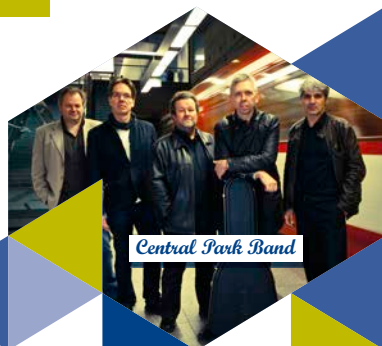
Central Park Band